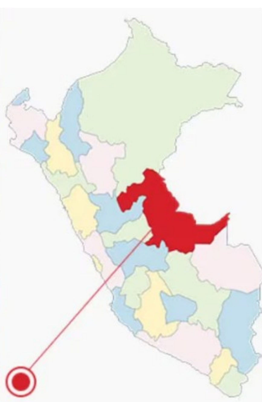
Ucayali es la segunda región más grave en casos de anemia infantil. (Composición Infobae)

En 1958, la OMS estableció que el principal tratamiento para la anemia debe ser la suplementación con hierro; desde entonces, todos los gobiernos aplican intervenciones de suplementos de hierro y fortificación de alimentos con hierro para reducir la anemia.