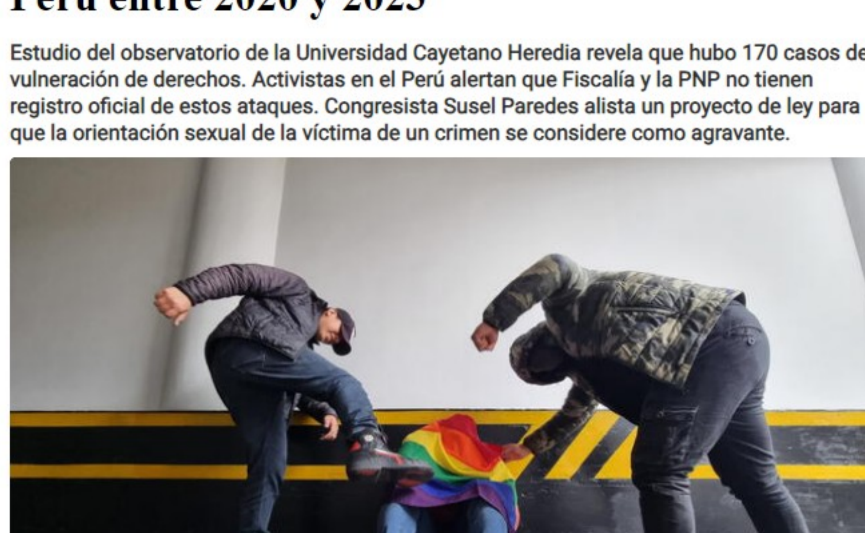
Los casos de abusos y asesinatos han ido en aumento desde 2020. No hay cifras oficiales del número de víctimas. Kevin García

Estudio del observatorio de la Universidad Cayetano Heredia revela que hubo 170 casos de vulneración de derechos. Activistas en el Perú alertan que Fiscalía y la PNP no tienen registro oficial de estos ataques. Congresista Susel Paredes allista un proyecto de ley para que la orientación sexual de la víctima de un crimen se considere como agravante.